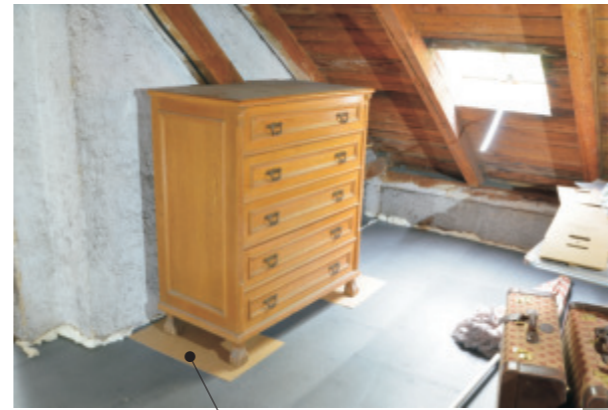
Unterlagsplatte bei Kästen, Regalen