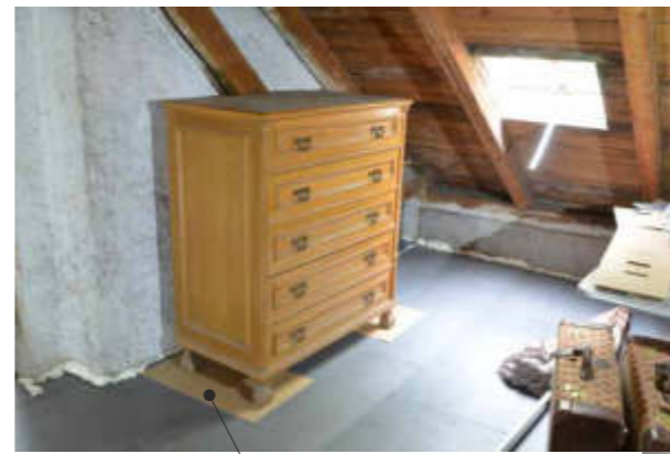
Unterlagsplatte bei Kästen, Regalen